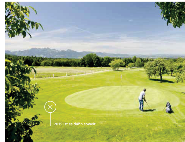
2019 ist es dann soweit ...