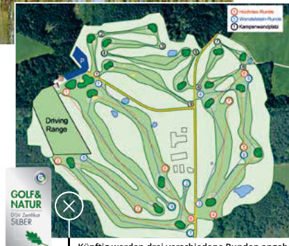
GOLF & NATUR DIE ZUMBIER SILBER Künftig werden drei verschiedene Runden angeboten

Das Highlight in Patting wird der Reversible-Platz sein, der der erste seiner Art in Deutschland sein wird. Je nach Wochentag wird der Reversible-Platz entweder in der einen Richtung als 9 Loch-Hochries-Runde oder in der anderen Richtung als 9 Loch-Wendelstein-Runde gespielt. Der Platz besitzt also 9 Grüns, aber 18 Spielbahnen. Beide Runden spielen sich als Par 35. Das Konzept eines Reversible-Platzes stammt bereits aus dem 19. Jahrhundert. Einer der ersten Reversible-Plätze der Welt war der Old Course in St. Andrews, der für viele Jahre sowohl in Uhrzeigersinn als auch gegen den Uhrzeigersinn gespielt wurde. Auch heute noch wird einmal jährlich in St. Andrews die Spielrichtung umgedreht und der Platz wieder im Uhrzeigersinn gespielt. Die Attraktivität des Reversible-Platzes in Patting besteht darin, dass auf einer Fläche eines 9-Loch-Platzes die Golfer