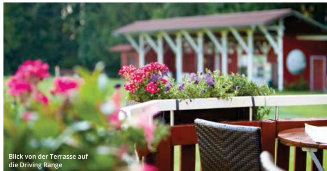
Blick von der Terrasse auf die Driving Range

Das Highlight in Patting wird der Reversible-Platz sein, der der erste seiner Art in Deutschland sein wird. Je nach Wochentag wird der Reversible-Platz entweder in der einen Richtung als 9 Loch-Hochries-Runde oder in der anderen Richtung als 9 Loch-Wendelstein-Runde gespielt. Der Platz besitzt also 9 Grüns, aber 18 Spielbahnen. Beide Runden spielen sich als Par 35. Das Konzept eines Reversible-Platzes stammt bereits aus dem 19. Jahrhundert. Einer der ersten Reversible-Plätze der Welt war der Old Course in St. Andrews, der für viele Jahre sowohl in Uhrzeigersinn als auch gegen den Uhrzeigersinn gespielt wurde. Auch heute noch wird einmal jährlich in St. Andrews die Spielrichtung umgedreht und der Platz wieder im Uhrzeigersinn gespielt. Die Attraktivität des Reversible-Platzes in Patting besteht darin, dass auf einer Fläche eines 9-Loch-Platzes die Golfer