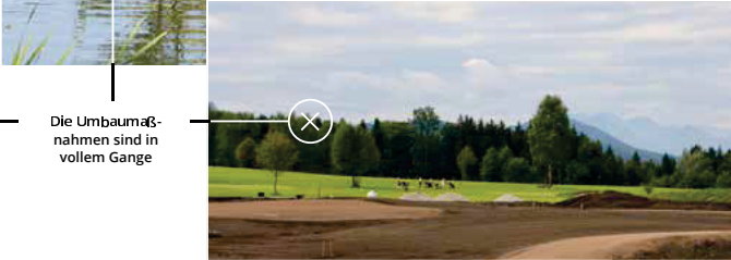
Die Umbaumaßnahmen sind in vollem Gange